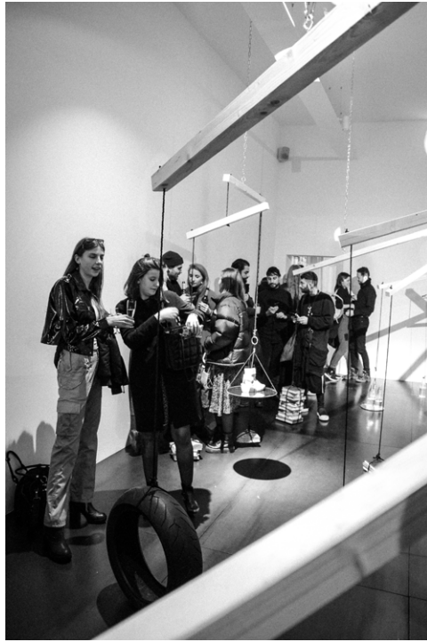
Concept by Jakub Kubica